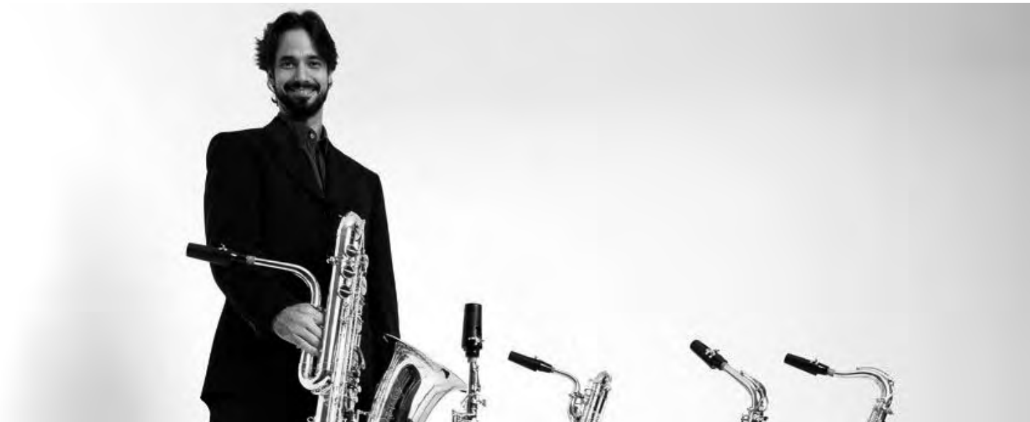
PEDRO BITTENCOURT (BRAZIL) | CONCIERTO EN VIVO www.pedrobittencourt.info/

Este evento es parte de una Muestra Internacional que propone el uso del arte y las tecnologías de comunicación al servicio de la convivencia.