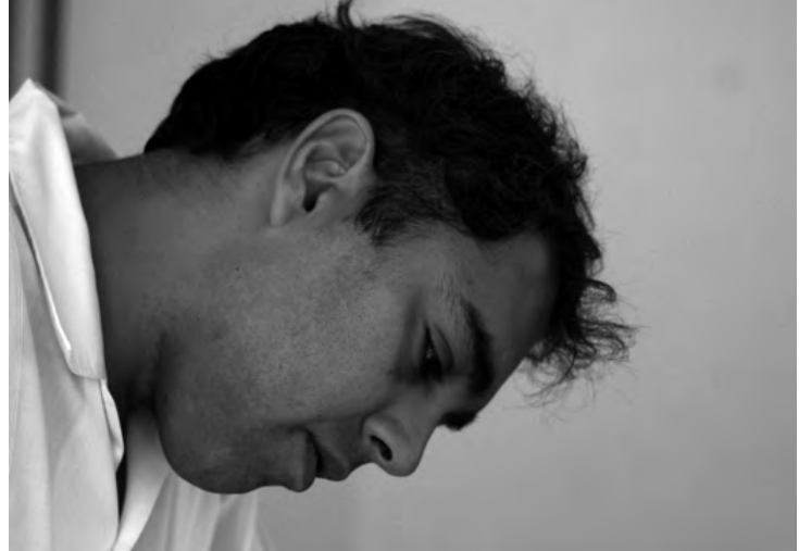
PEDRO CASTILLO LARA (CIUDAD DE MÉXICO) | DELPHINU Para saxofón soprano y sonidos electrónicos

Kari Väkevä (b 1957) is a Finnish composer and sound artist whose oeuvre includes orchestral works such as Symphony (1976-1979) which was partly recorded by Finnish RSO/Jorma Panula in 1982 and Elegia (1989-1990) performed by RSO Frankfurt/ Diego Masson in 2005, and electroacoustic works like Ray 6 (2002) performed in New Orleans at ICMC 2006, Halo (2005-2007) performed in Belfast at ICMC 2008, p(X) (2011) performed in Ljubljana at ICMC 2012, Sundog i (2012-2015) performed in Kansas City at EMM 2015, and Sundog ii (2012-2015) performed in New York City at NYCEMF 2016. An installation Diptych - A Sonic Installation was exhibited in Blacksburg, VA, in 2016. Early works are acoustic. From 2001 onward the electroacoustic works use computer to synthesize the sound: Csound, and from 2003 with MAL-d, an evolving synthesis software. He is selfeducated as a composer.